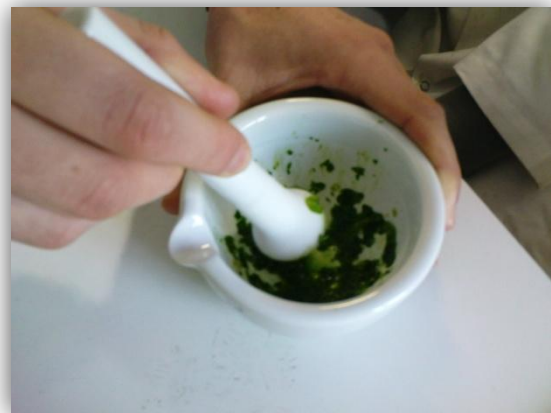
1. bereiden chlorofylpreparaat

We halen een aantal blaadjes veldsla en gooien ze in de mortier, samen met een aantal druppels aceton en een eetlepel zilverzand. Nu stampen we de inhoud fijn met de stamper. Er zal groene vloeistof gevormd worden. Deze vloeistof is een chlorofyloplossing. Nu gebruiken we de capillair. Dit uiterst smalle buisje creëert een druk door de grote wandspanning en zuigt zo gebruikmakend van de capillaire eigenschappen, het water vanzelf naar binnen. We tekenen een startlijn met